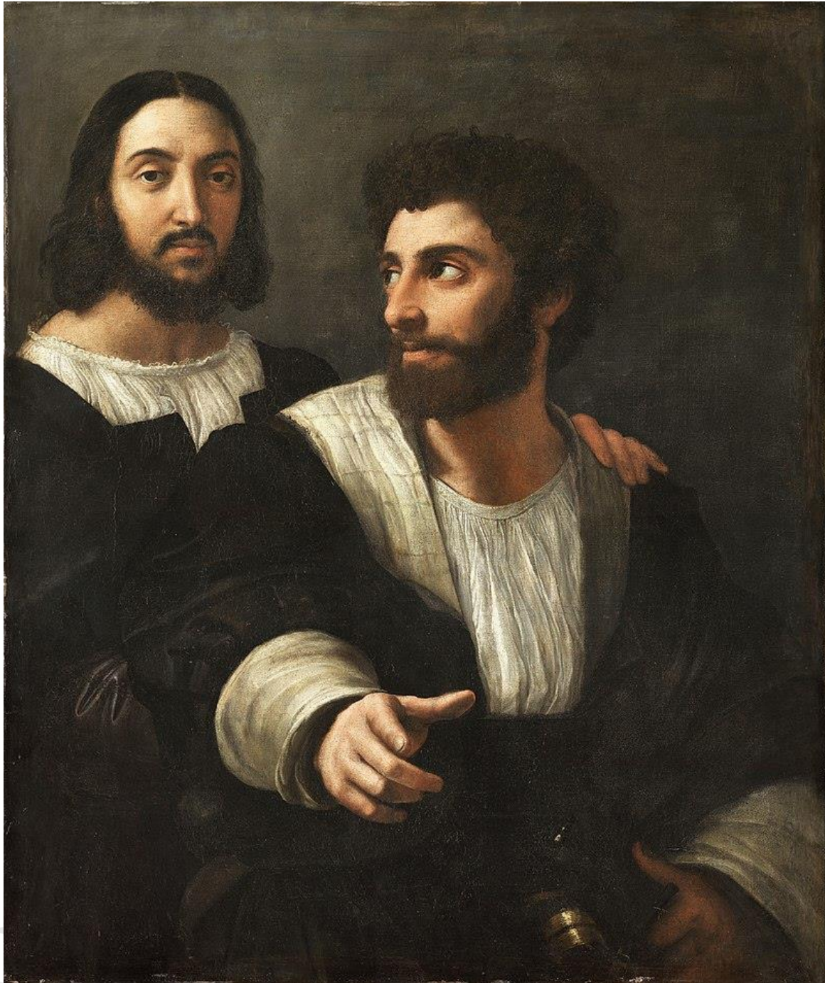
Raffaello, Autoportrait avec un ami , 1518, huile sur toile, Musée du Louvre, Paris.

Raphaël s'est ici représenté au second plan, derrière un ami dont l'identité n'est pas certaine.