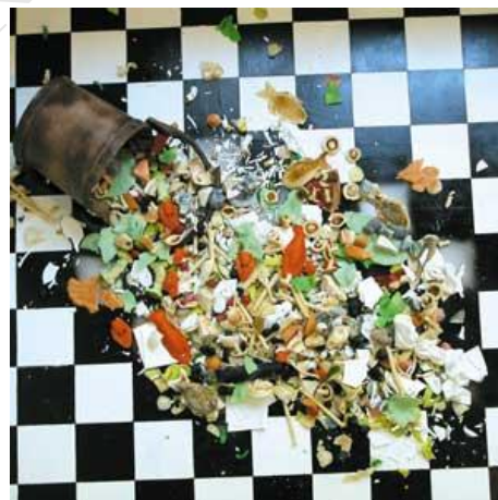
Daniel Spoerri, Poubelle (Palindromic Dinner) , 1961

N.B.: Qualora la commissione lo ritenga opportuno, potrà a sua discrezione fornire a tutti gli studenti materiali iconografici utili allo svolgimento della prova, scaricandoli da internet prima dell’inizio della prova stessa.