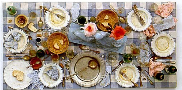
Daniel Spoerri, Sevilla – Serie Nr. 27 Assemblage, 1992

Daniel Spoerri, inventore della Eat Art , ha il merito di aver mostrato in maniera giocosa, “pop” e provocatoria la continua attrazione dell’umanità nei confronti del cibo; con i suoi assemblaggi di cibo, tavole apparecchiare e utensili da cucina è riuscito a trovare un legame fra arte e vita quotidiana.