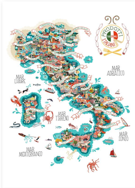
Mappa dell'Italia con i prodotti tipici

Vengono di seguito forniti alcuni elementi che possono ispirare il candidato.