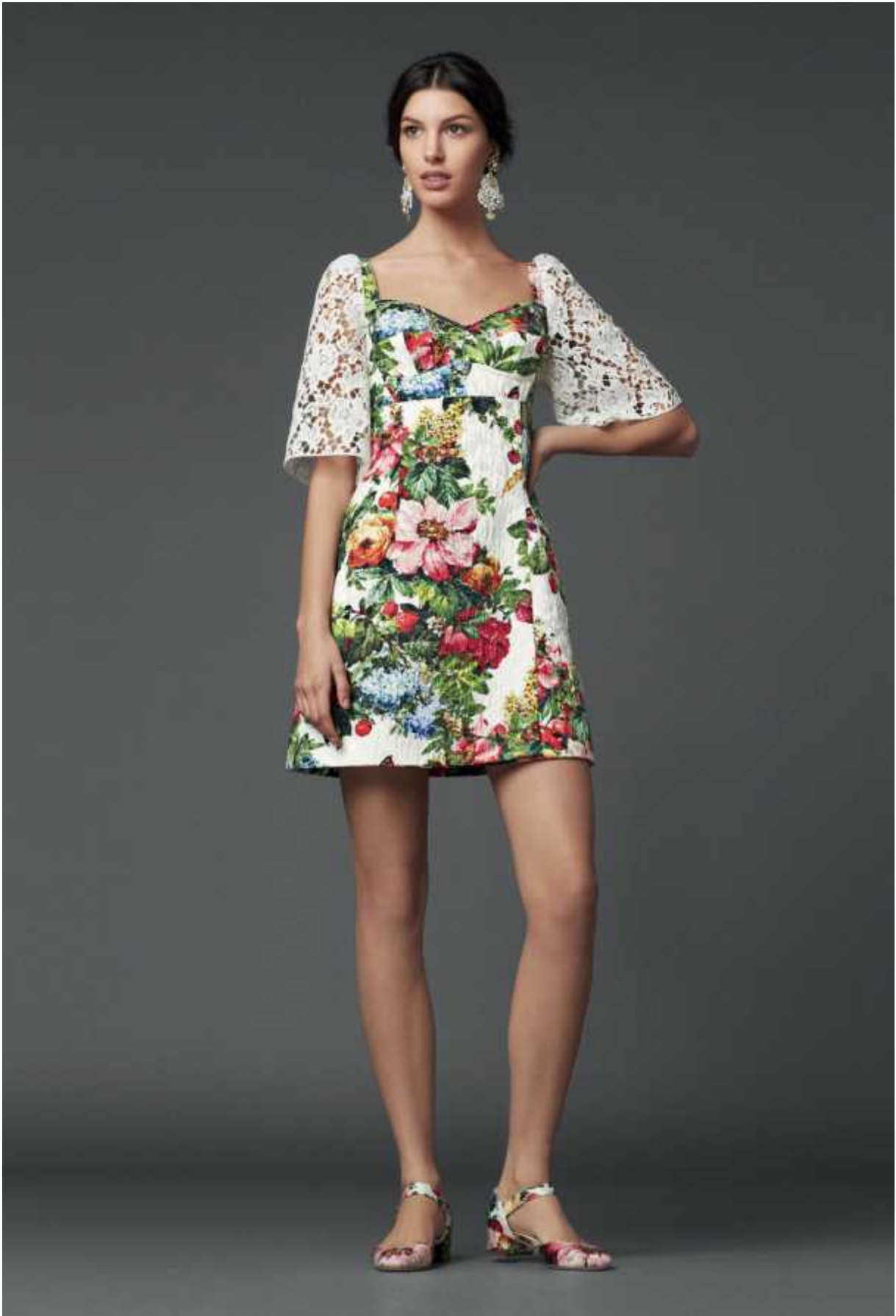
Figura 2: Dolce&Gabbana A/I 2014 women-collection