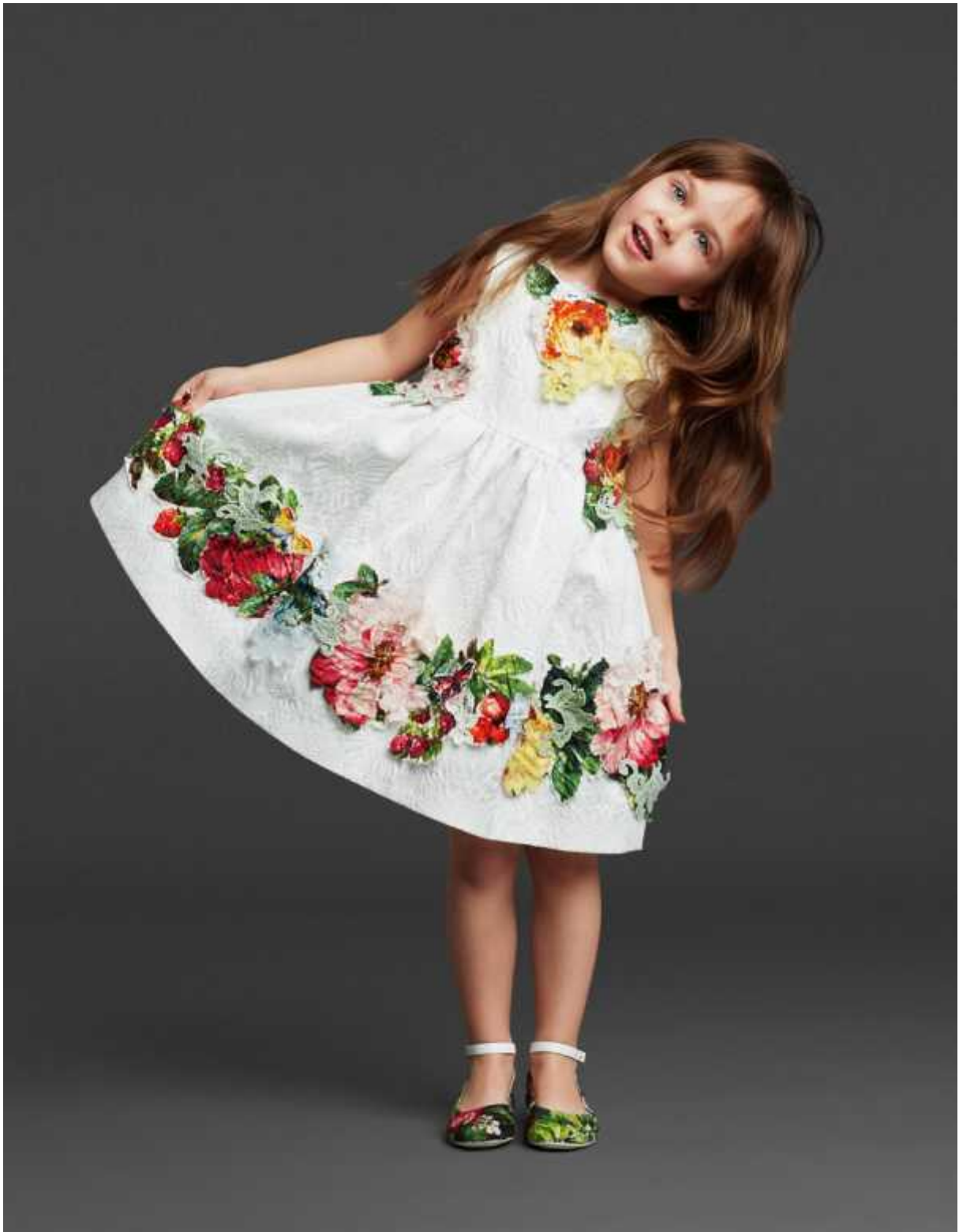
Figura 3: Dolce&Gabbana A/I 2014 kids-collection