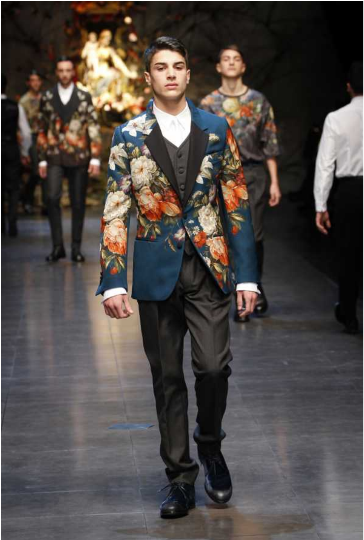
Figura 1: Dolce&Gabbana A/I 2014 men-collection