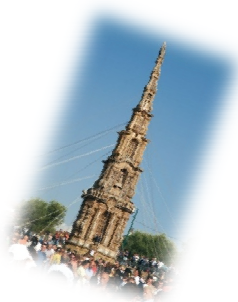
Obelisco di paglia