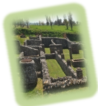
Parco Archeologico Aeclanum