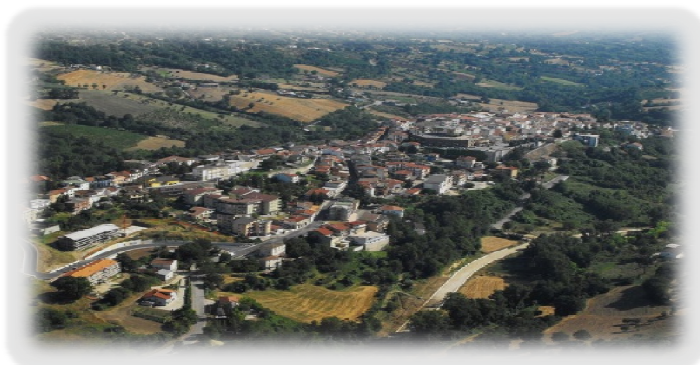
CITTÀ DI MIRABELLA ECLANO