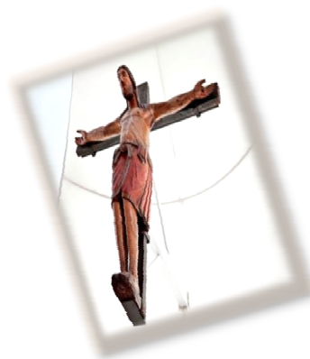
Cattedrale Santa Maria Maggiore Crocifisso Normanno (Sec. XII)