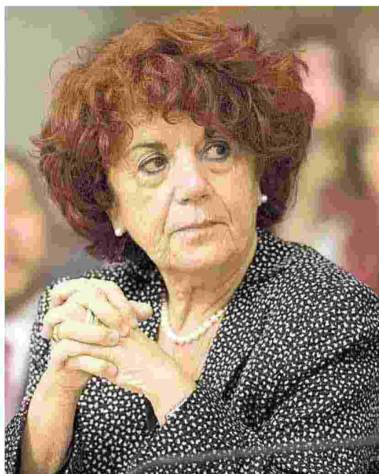
La ministra dell'Istruzione Valeria Fedeli

Cacciari sbaglia: non è vero che la scuola oggi punta solo al lavoro